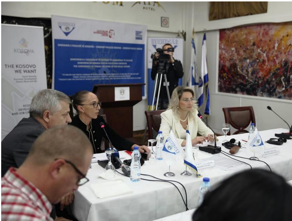
Figura 4. Konferenca rajonale e seksioneve të femrave të sindikatave të policisë

Në konferencë morën pjesë delegacionet e rrjeteve të grave të sindikatave të Policisë nga Kroacia, Mali i Zi, Shqipëria dhe Maqedonia, konfederata sindikale e BSPK-së dhe federatat sindikale vendore. Në fund të punës së konferencës unanimisht u mbështetën: