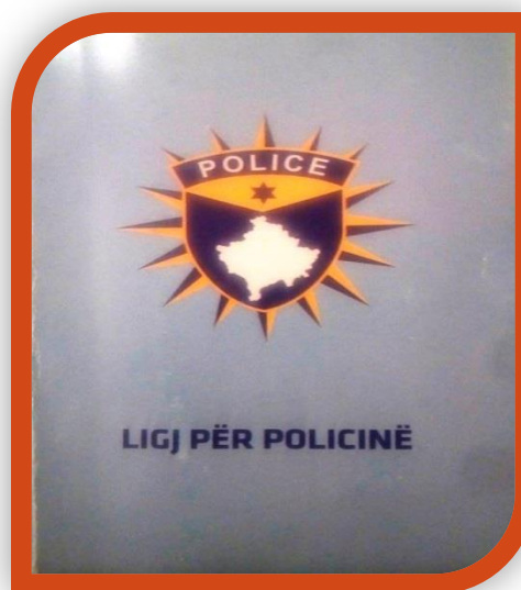
Figura 6: Ligji për Policinë e Kosovës

3. Personeli policor nuk ka të drejtë të bëjë grevë, por ka të drejtë t'i shprehë pakënaqësitë e tij nëpërmjet protestave të organizuara dhe të udhëhequra nga organet përfaqësuese.