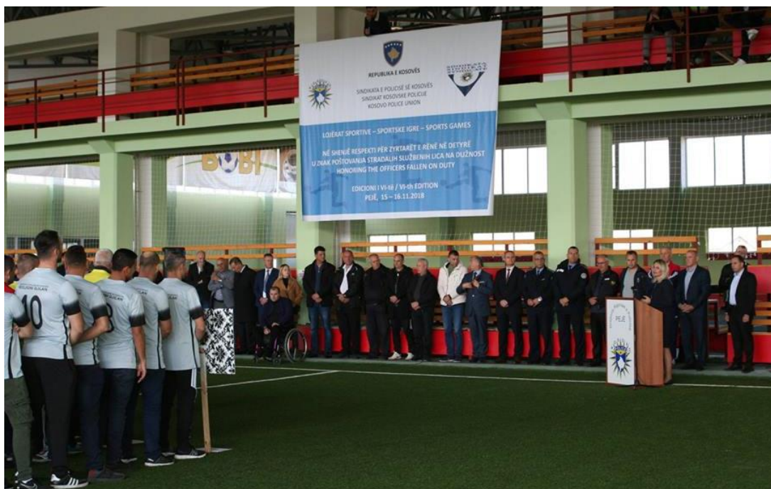
Figura 3: Lojërat Sportive 2018

Sindikata e Policisë së Kosovës, në shenjë respekti dhe përkujtimi për zyrtarët policorë të rënë në detyrë, organizon Lojërat Tradicionale Sportive. Kësisoj, vitin e kaluar u organizua dhe u mbajt Edicioni i VI-të i lojërave sportive në Pejë.