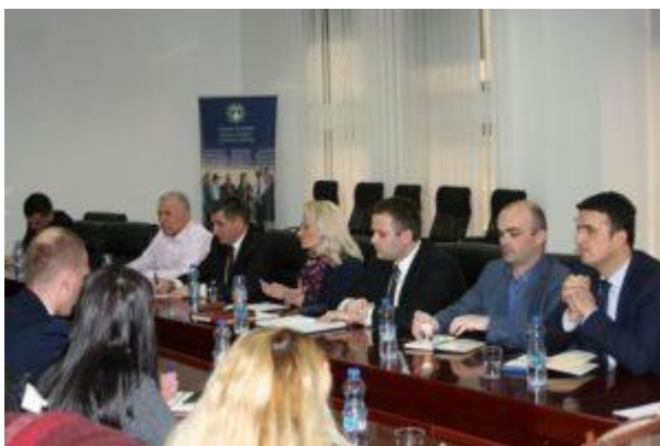
Figura 5: Takimi i Sindikatës të Policisë së Kosovës së bashku me stafin e lartë menaxherial të Policisë së Kosovës

Gjate vitit 2018, sindikata e PK-së i është drejtuar me kërkesa zyrtare kryeministrit të Qeverisë së Kosovës, ministrit të Financave, ministrit të Punëve të Brendshme dhe drejtorit të Përgjithshëm të Policisë së Kosovës në lidhje me sigurimin shëndetësor dhe aksidental alternativ, kërkesë kjo e cila deri më tani nuk ka hasur në mirëkuptim edhe pas shumë presioneve.