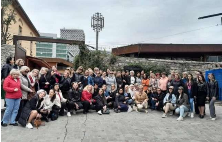
Sindikata e Policisë së Kosovës -Njësia Sindikale e Aeroportit - Kufirit, gjatë fundjavës kanë zhvilluar një ekskursion shetitje – aktivitet sindikal në shtetin e Shqipërisë.